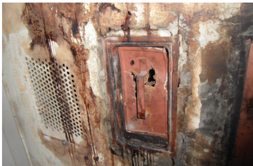
Slika 4: Poškodbe dimovodnih naprav

Lastnik oz. uporabnik je dolžan omogočiti in zagotoviti redno letno neodvisno meritev emisije dimnih plinov, da se preveri vplive kurilne naprave na okolje, učinkovito rabo energije, tlačne razmere in prisotnost nevarnih koncentracij CO v dimnih plinih.