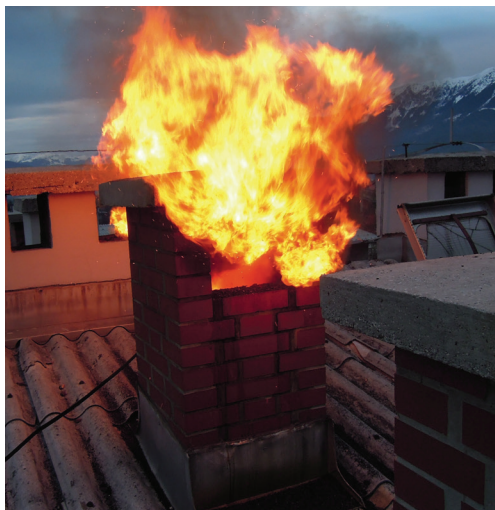
Slika 2: Dimniški požar v razviti fazi – pomembnost lokacije ustja dimovodne naprave