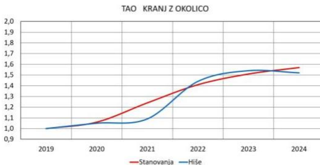
Slika 17: Gibanje cen stanovanj in hiš, TAO Kranj z okolico, od leta 2019 do 2024 (osnova so cene v letu 2019)